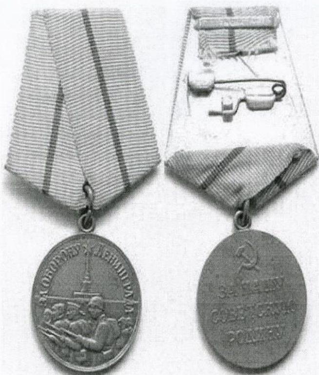
медаль за оборону Ленинграда