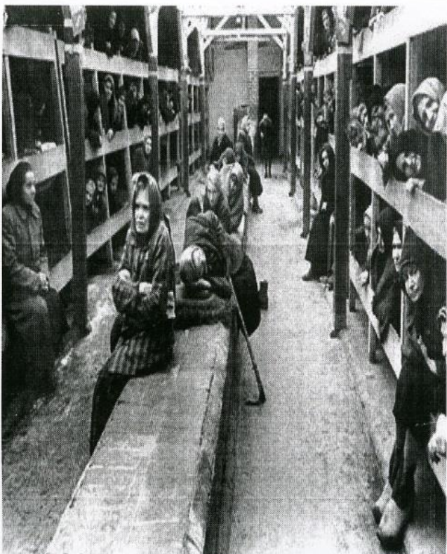
бараки лагеря Равенсбрю